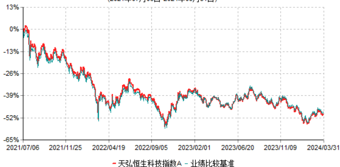
天弘恒生科技指数A累计净值增长率与业绩比较基准收益率历史走势对比图 (2021年07月06日-2024年03月31日)