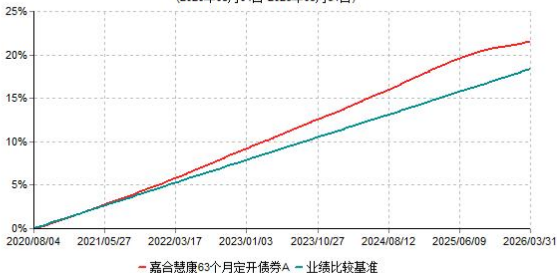
嘉合慧康63个月定开债券A累计净值增长率与业绩比较基准收益率历史走势对比图 (2020年08月04日-2026年03月31日)