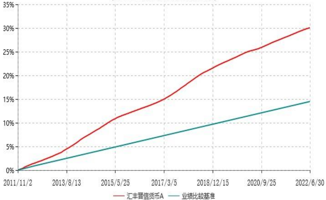
汇丰晋信货币A累计净值收益率与业绩比较基准收益率历史走势对比图 (2011年11月02日-2022年06月30日)