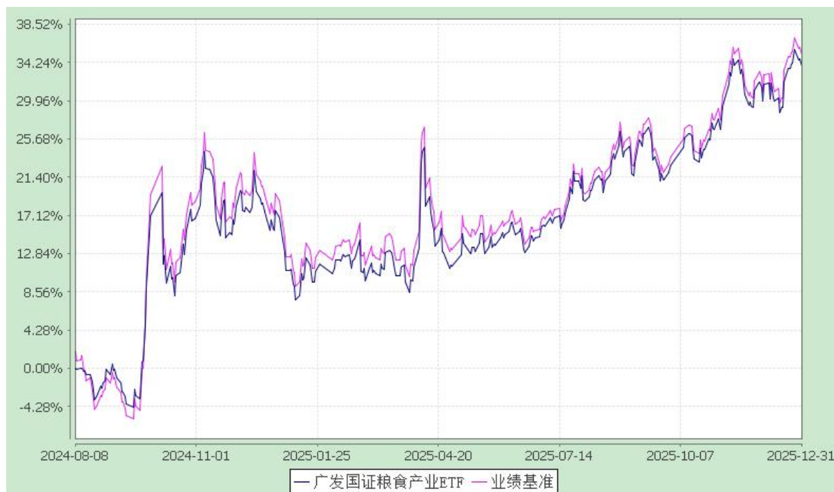
广发国证粮食产业交易型开放式指数证券投资基金 份额累计净值增长率与业绩比较基准收益率的历史走势对比图 (2024 年 8 月 8 日至 2025 年 12 月 31 日)

注：本基金建仓期为基金合同生效后 6 个月，建仓期结束时各项资产配置比例符合本基金合同有关规定。