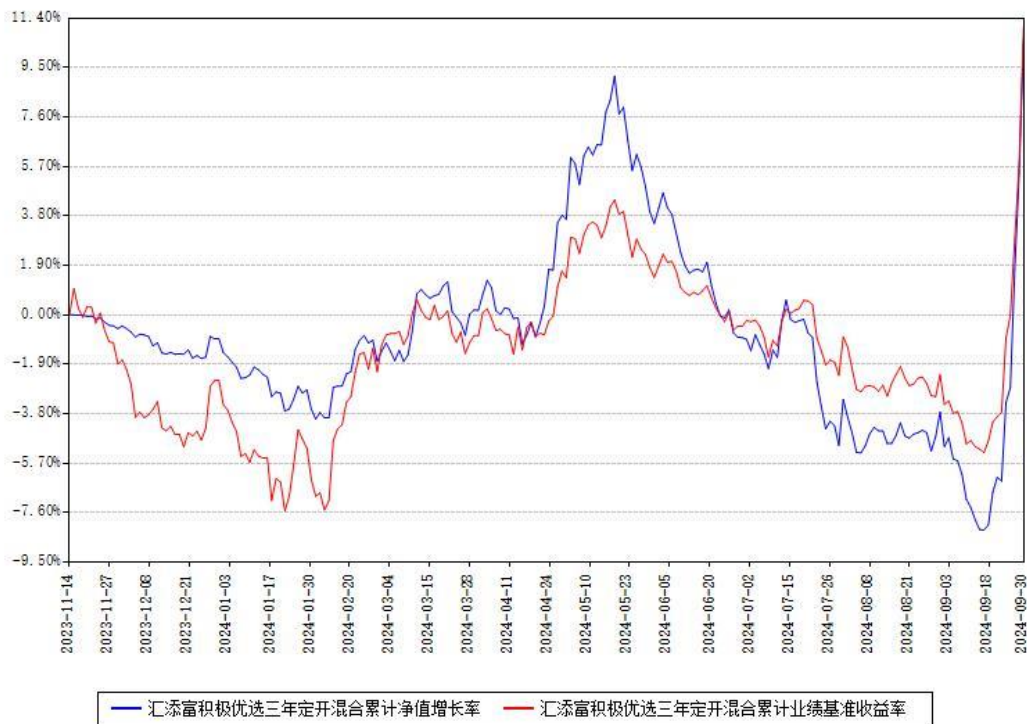
汇添富积极优选三年定开混合累计净值增长率与同期业绩基准收益率对比图