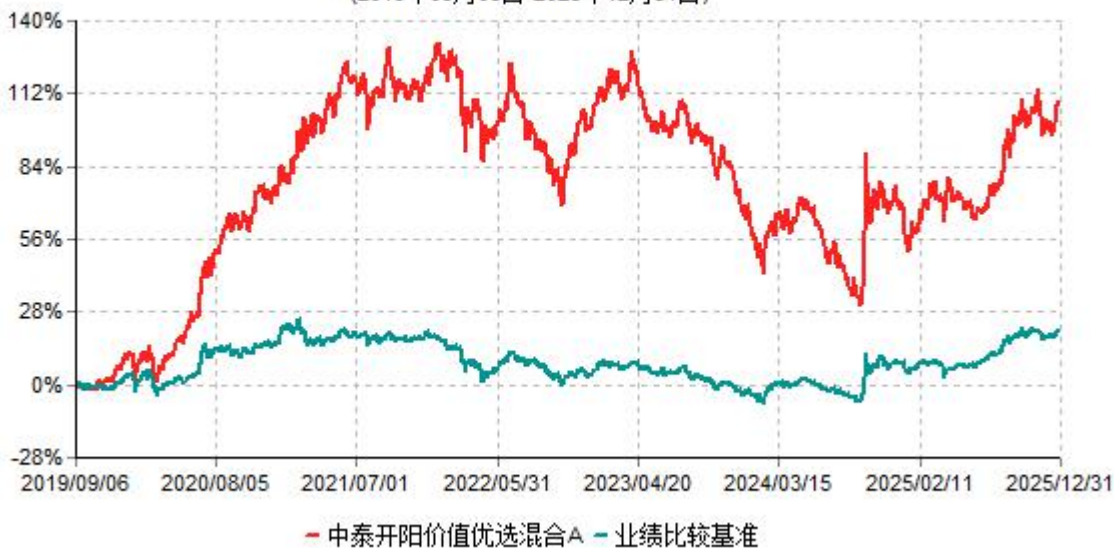
中泰开阳价值优选混合A累计净值增长率与业绩比较基准收益率历史走势对比图 (2019年09月06日-2025年12月31日)