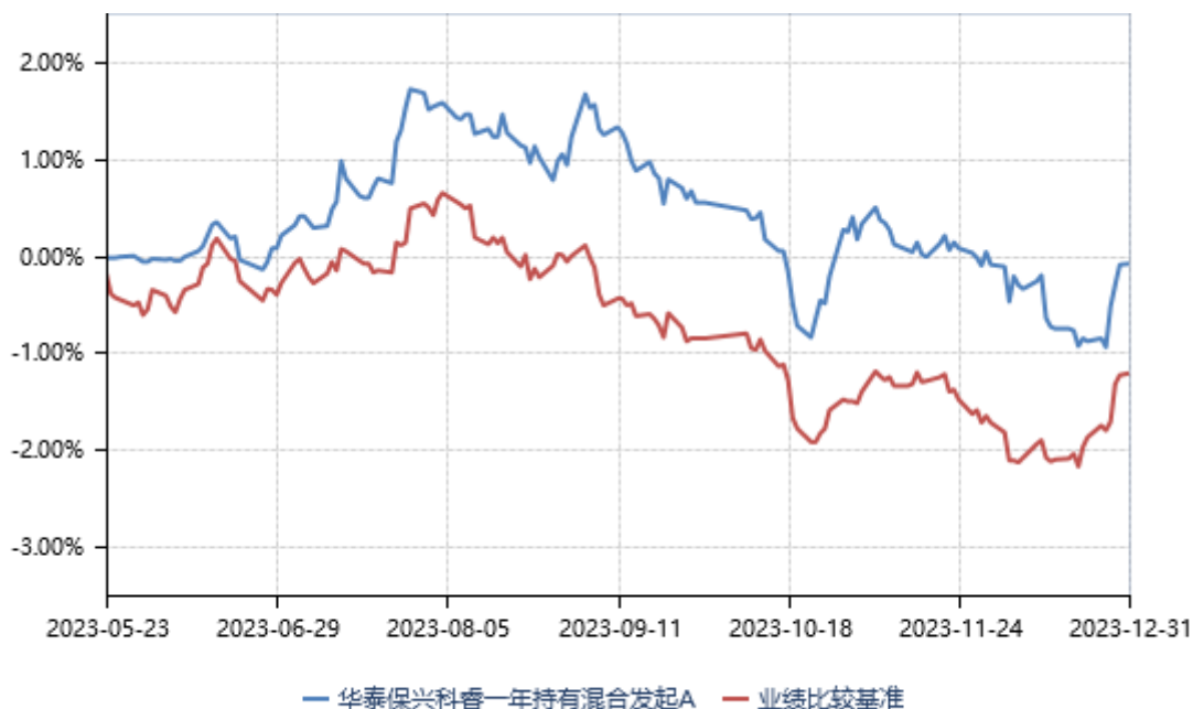
华泰保兴科睿一年持有混合发起A