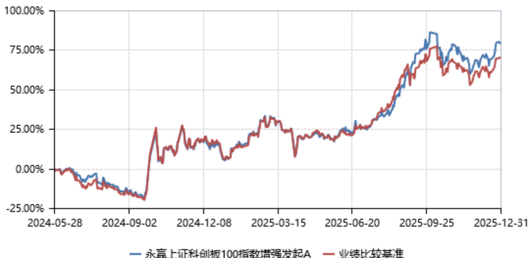
永赢上证科创板100指数增强发起A累计净值收益率与业绩比较基准收益率历史走势对比图 (2024年05月28日-2025年12月31日)