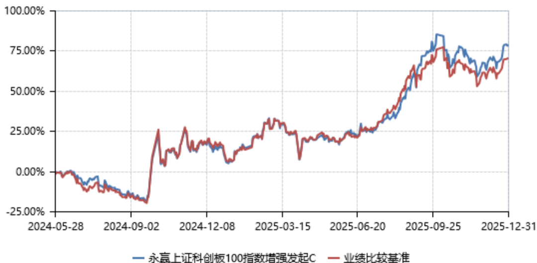
永赢上证科创板100指数增强发起C累计净值收益率与业绩比较基准收益率历史走势对比图 (2024年05月28日-2025年12月31日)