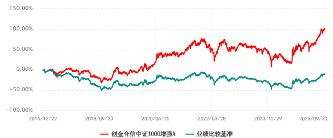
创金合信中证1000增强A累计净值增长率与业绩比较基准收益率历史走势对比图 (2016年12月22日-2025年09月30日)