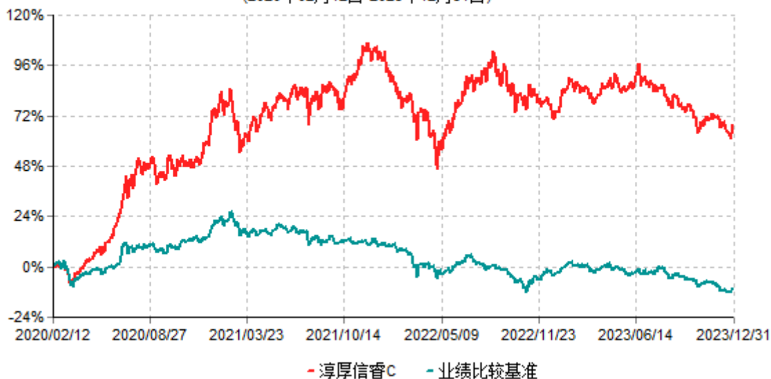
淳厚信睿C累计净值增长率与业绩比较基准收益率历史走势对比图 (2020年02月12日-2023年12月31日)

注：本基金基金合同生效日为2020年2月12日。按基金合同约定，本基金自基金合同生效起6个月内为建仓期。建仓期结束时本基金的各项投资比例均符合基金合同约定。