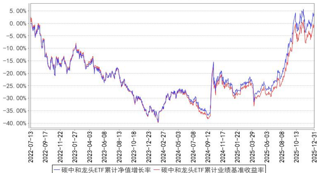
碳中和龙头ETF累计净值增长率与同期业绩比较基准收益率的历史走势对比图