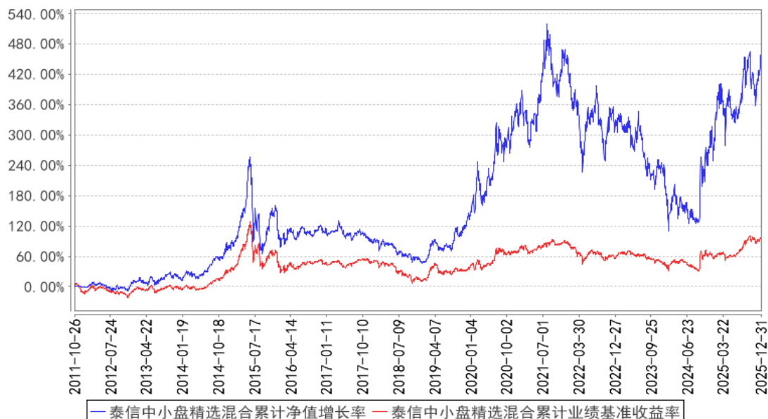
泰信中小盘精选混合累计净值增长率与同期业绩比较基准收益率的历史走势对比图

注：1、本基金合同于 2011 年 10 月 26 日正式生效。本基金自 2015 年 8 月 7 日起变更为混合型基金。