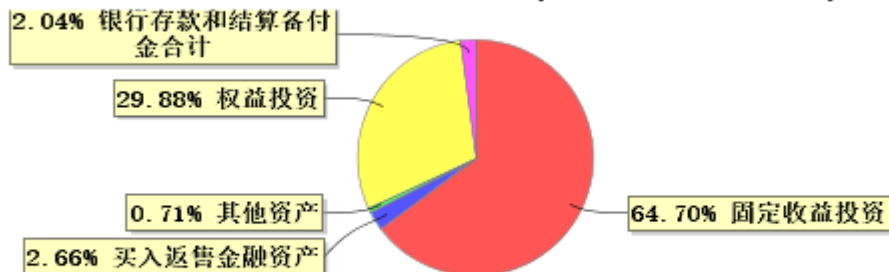
投资组合资产配置图表(2024年9月30日)

● 固定收益投资 ● 买入返售金融资产 ● 其他资产 ● 权益投资 ● 银行存款和结算备付金合计