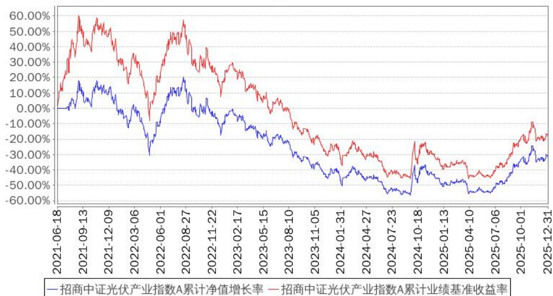
招商中证光伏产业指数A累计净值增长率与同期业绩比较基准收益率的历史走势对比图