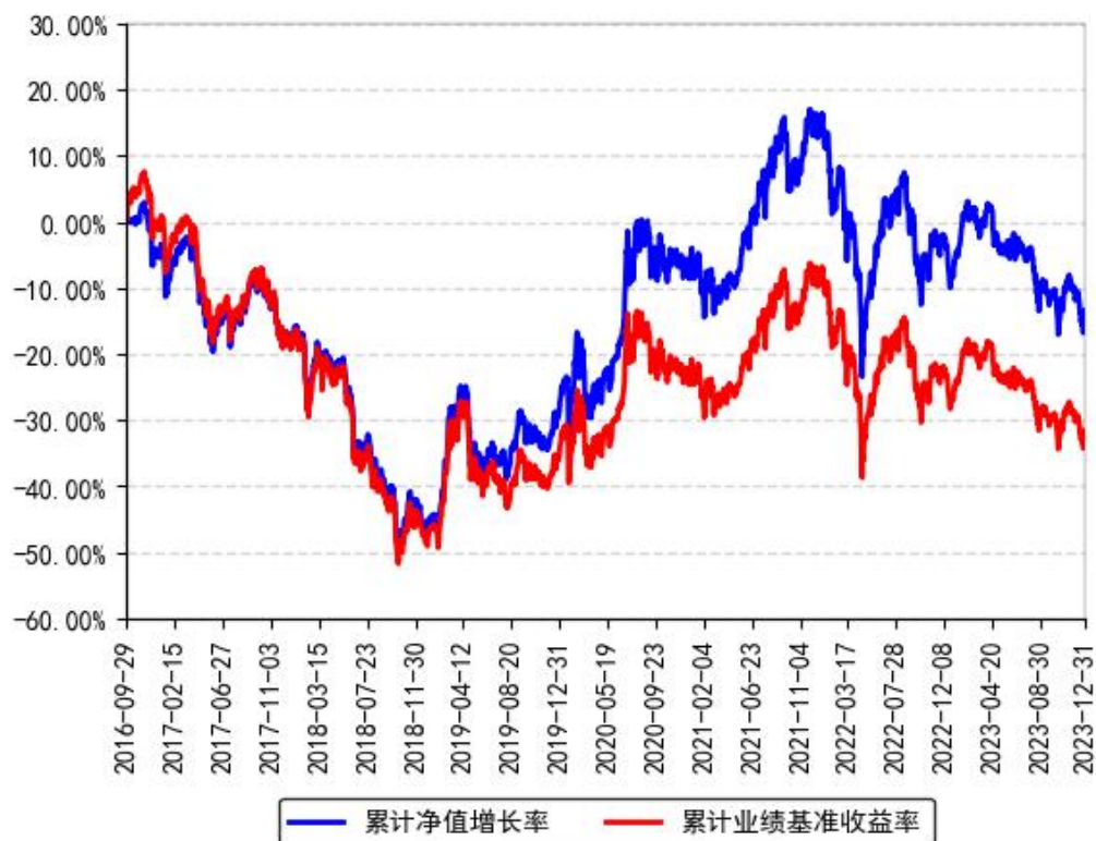
南方中证1000ETF累计净值增长率与同期业绩比较基准收益率的历史走势对比图