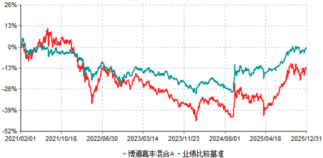
博道嘉丰混合A累计净值增长率与业绩比较基准收益率历史走势对比图 (2021年02月01日-2025年12月31日)

注：本基金建仓期为自基金合同生效日起的6个月。截至建仓期结束，本基金各项资产配置比例符合基金合同及招募说明书有关投资比例的约定。