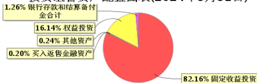
投资组合资产配置图表(2024年3月31日)

● 固定收益投资 ● 买入返售金融资产 ● 其他资产 ● 权益投资 ● 银行存款和结算备付金合计