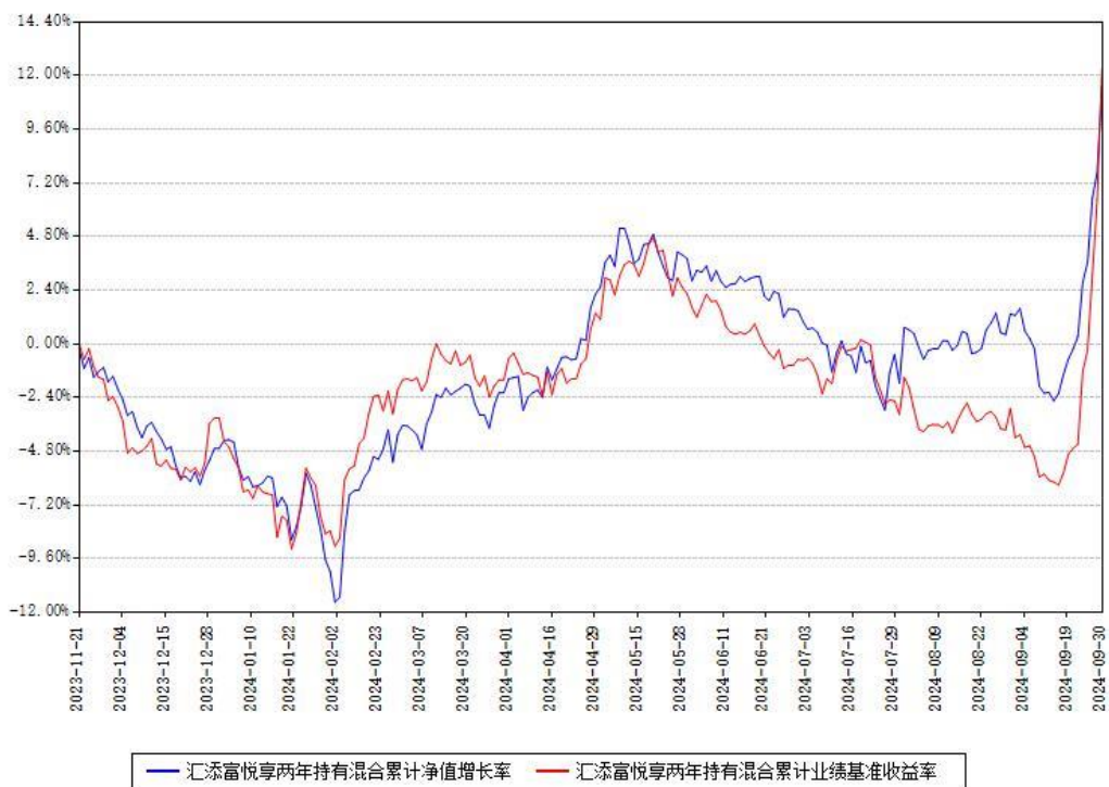
汇添富悦享两年持有混合累计净值增长率与同期业绩基准收益率对比图