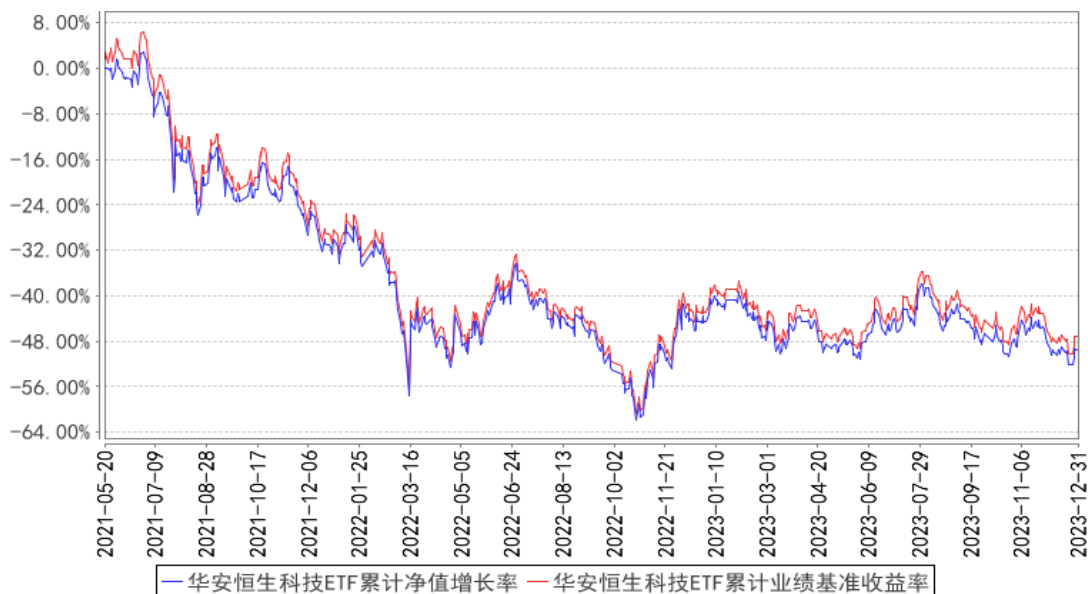
华安恒生科技ETF累计净值增长率与同期业绩比较基准收益率的历史走势对比图