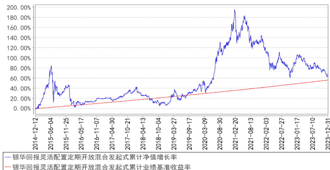
银华回报灵活配置定期开放混合发起式累计净值增长率与同期业绩比较基准收益率的历史走势对比图

注：按基金合同的规定，本基金自基金合同生效起六个月内为建仓期，建仓期结束时本基金的各项投资比例已达到基金合同的规定：股票投资比例为基金资产的 0%-95%；权证投资比例为基金资产净值的 0-3%；开放期内的每个交易日日终，在扣除股指期货合约需缴纳的交易保证金后，应当保持不低于基金资产净值 5%的现金或到期日在一年以内的政府债券。在封闭期内，本基金不受上述 5%的限制，但每个交易日日终在扣除股指期货合约需缴纳的交易保证金后，应当保持不低于交易保证金一倍的现金。其中，现金不包括结算备付金、存出保证金、应收申购款等。