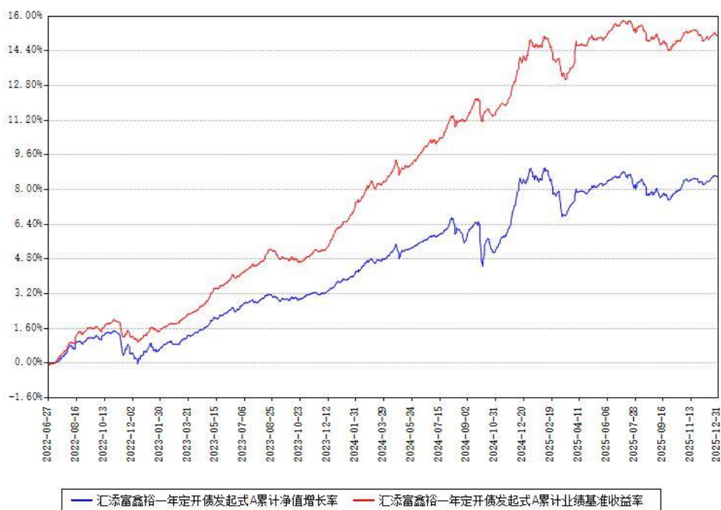
汇添富鑫裕一年定开债发起式A累计净值增长率与同期业绩基准收益率对比图

注：本基金建仓期为本《基金合同》生效之日（2022年06月27日）起6个月，建仓期结束时各项资产配置比例符合合同约定。