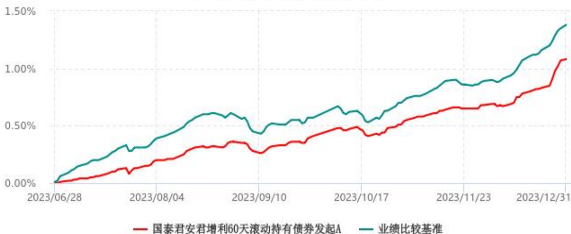
国泰君安君增利60天滚动持有债券发起A累计净值增长率与业绩比较基准收益率历史 走势对比图 (2023年06月28日-2023年12月31日)

注：1、本基金于 2023 年 06 月 28 日成立，自合同生效日起至本报告期末不足一年。 2、按基金合同和招募说明书的约定，本基金的建仓期为六个月，建仓期结束时各项资产配置比例符合基金合同的有关约定。