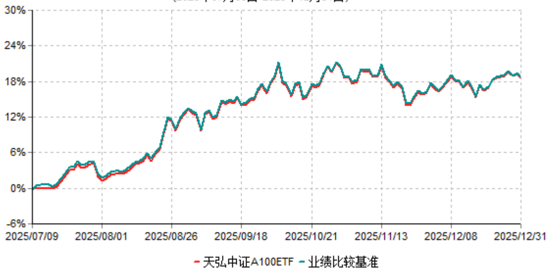
天弘中证A100ETF累计净值增长率与业绩比较基准收益率历史走势对比图 (2025年07月09日-2025年12月31日)

注：1、本基金合同于2025年07月09日生效，本基金合同生效起至披露时点不满1年。