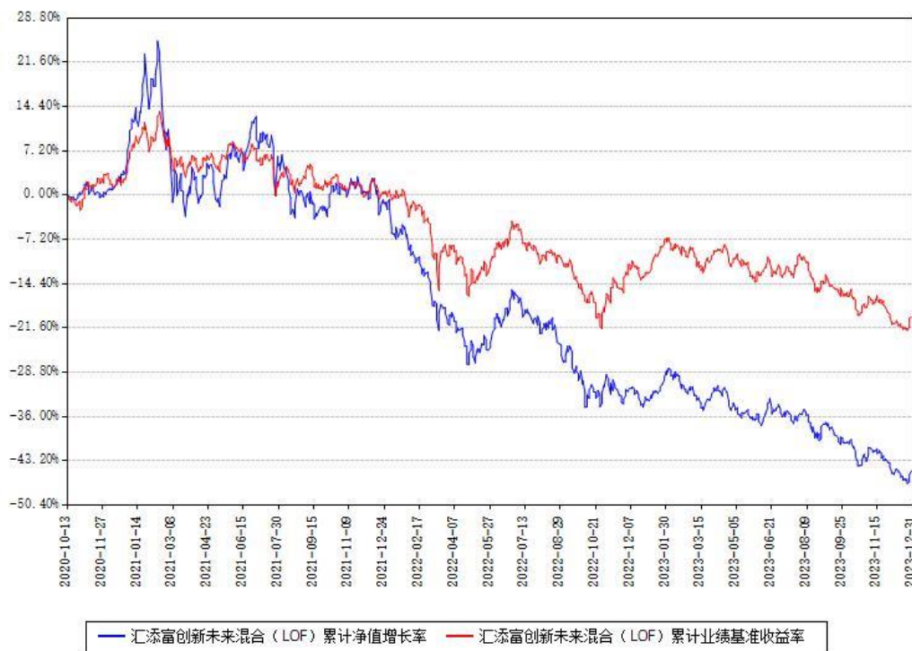
汇添富创新未来混合（LOF）累计净值增长率与同期业绩基准收益率对比图

注：本基金建仓期为本《基金合同》生效之日（2020年10月13日）起6个月，建仓期结束时各项资产配置比例符合合同约定。