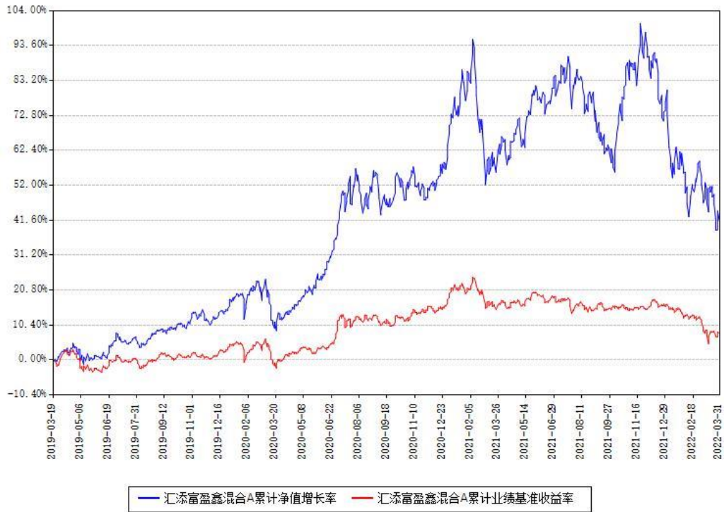
汇添富盈鑫混合A累计净值增长率与同期业绩基准收益率对比图