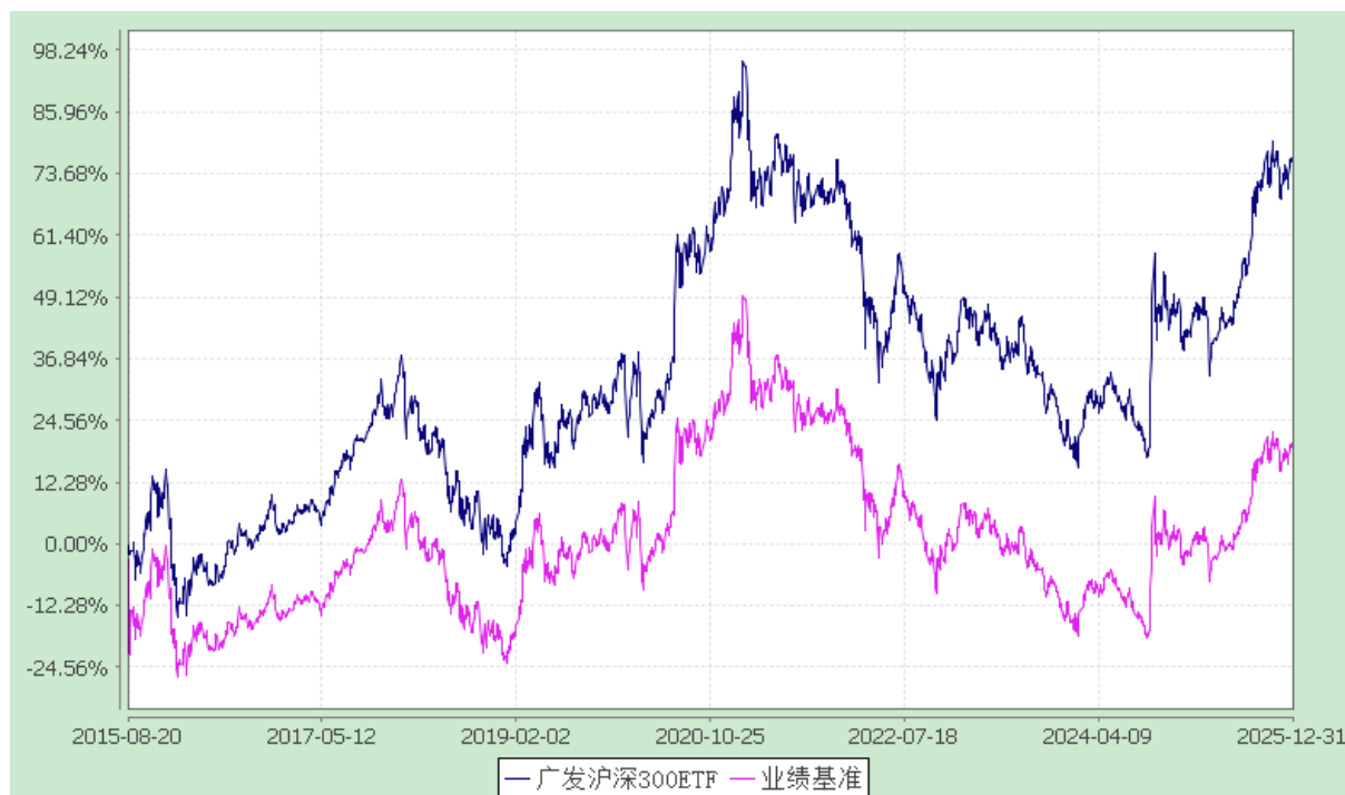
广发沪深 300 交易型开放式指数证券投资基金 份额累计净值增长率与业绩比较基准收益率的历史走势对比图 (2015 年 8 月 20 日至 2025 年 12 月 31 日)