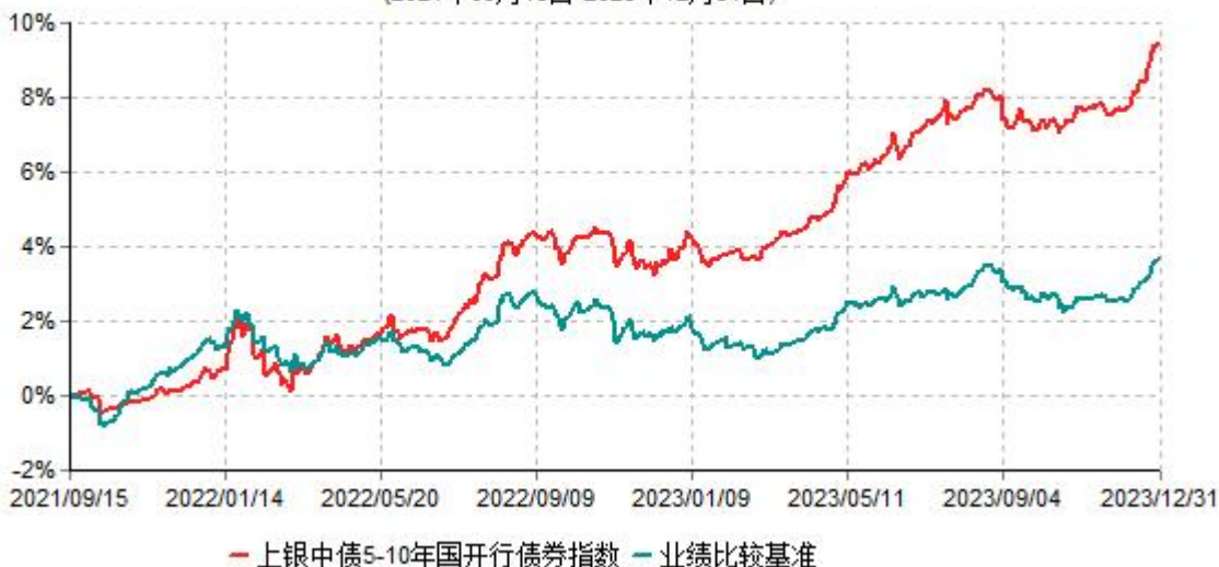
上银中债5-10年国开行债券指数证券投资基金累计净值增长率与业绩比较基准收益率历史走势对比图 (2021年09月15日-2023年12月31日)

注：本基金合同生效日为2021年9月15日，自基金合同生效日起6个月内为建仓期，建仓期结束时各项资产配置比例符合基金合同约定。