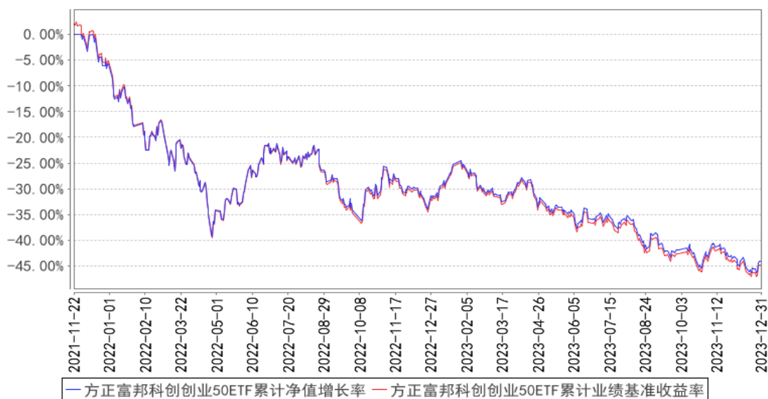
方正富邦科创创业50ETF累计净值增长率与同期业绩比较基准收益率的历史走势对比图