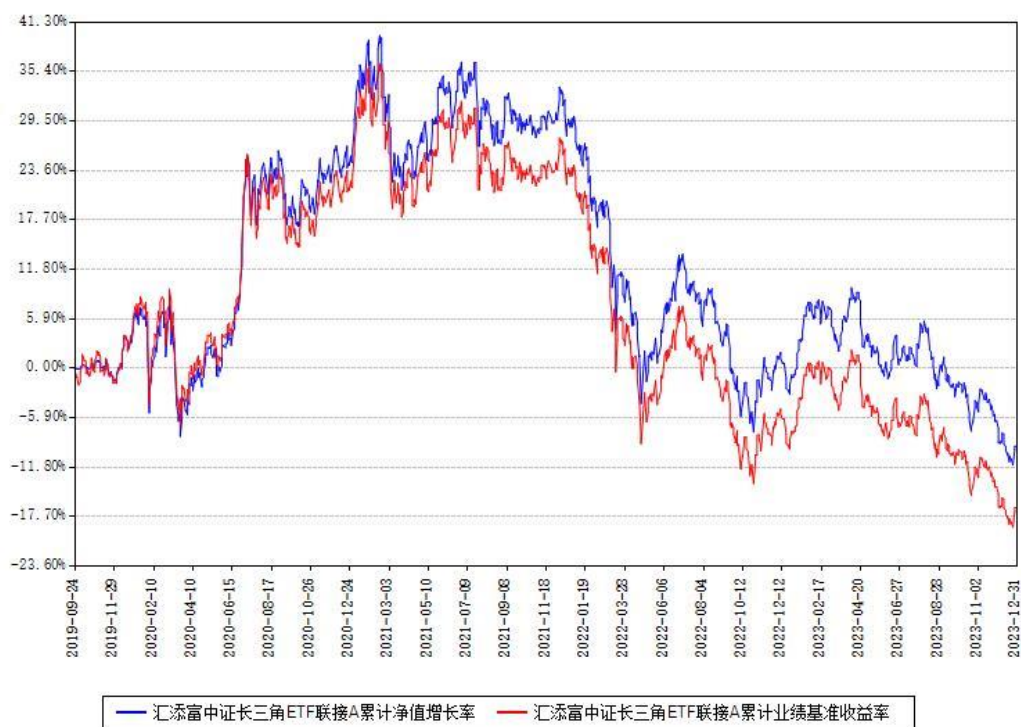
汇添富中证长三角ETF联接A累计净值增长率与同期业绩基准收益率对比图