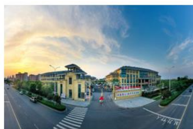
上海悦心泗洪康养中心