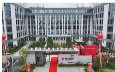
温州龙港市医养康教研示范园