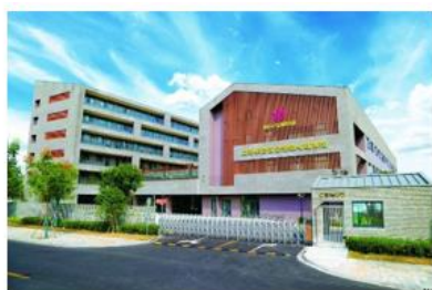
上海奉贤金海悦心颐养院