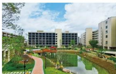
温州东方悦心中等职业技术学校