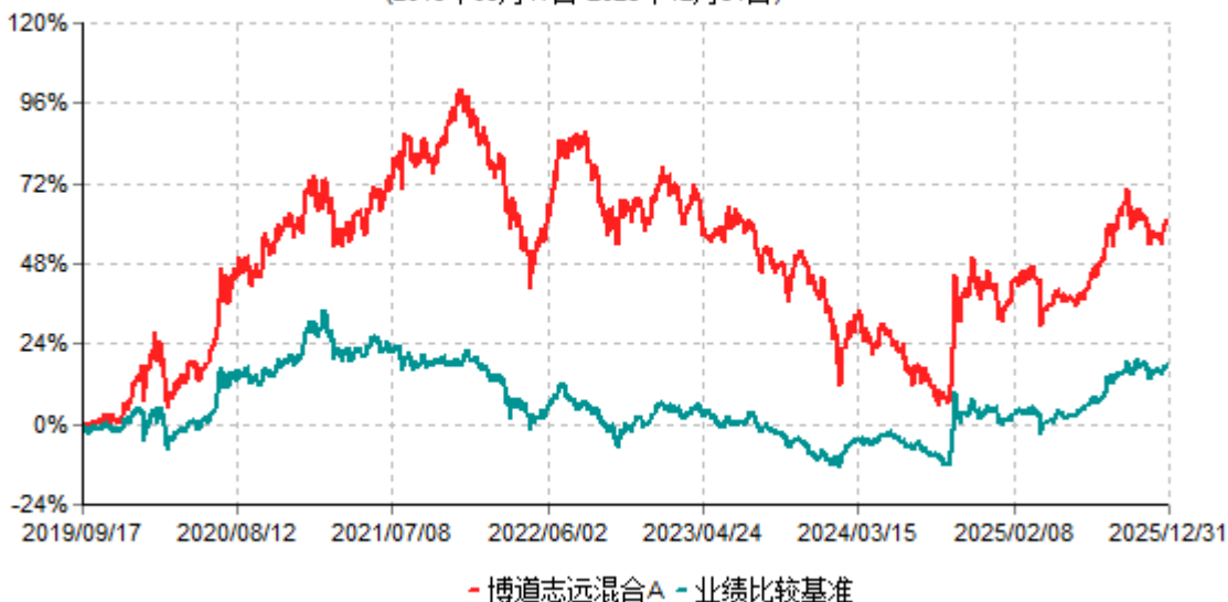
博道志远混合A累计净值增长率与业绩比较基准收益率历史走势对比图 (2019年09月17日-2025年12月31日)

注：本基金建仓期为自基金合同生效日起的6个月。截至建仓期结束，本基金各项资产配置比例符合基金合同及招募说明书有关投资比例的约定。