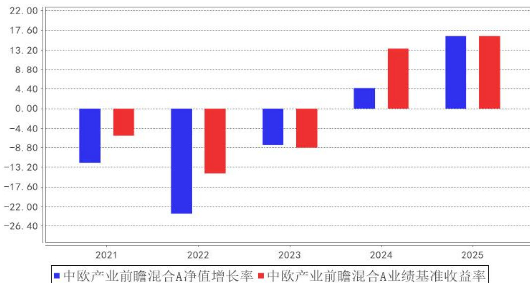
中欧产业前瞻混合A基金每年净值增长率与同期业绩比较基准收益率的对比图

注：本基金合同生效日为 2021 年 6 月 16 日，2021 年度数据为 2021 年 6 月 16 日至 2021 年 12 月 31 日数据。