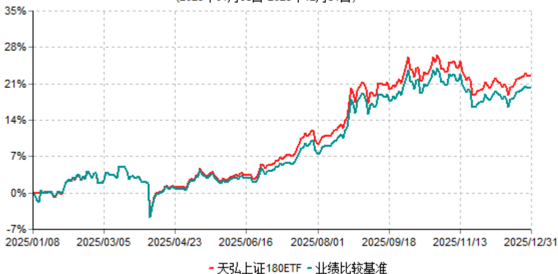
天弘上证180ETF累计净值增长率与业绩比较基准收益率历史走势对比图 (2025年01月08日-2025年12月31日)