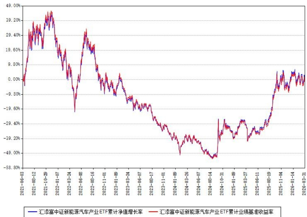
汇添富中证新能源汽车产业ETF累计净值增长率与同期业绩基准收益率对比图