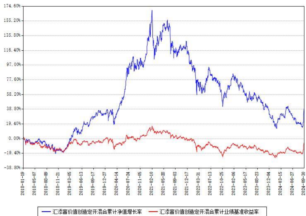
汇添富价值创造定开混合累计净值增长率与同期业绩基准收益率对比图