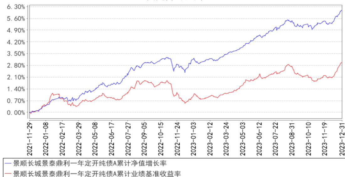
景顺长城景泰鼎利一年定开纯债A累计净值增长率与同期业绩比较基准收益率的历史走势对比图