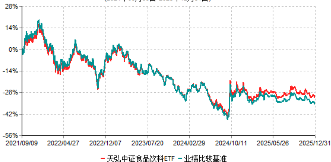
天弘中证食品饮料ETF累计净值增长率与业绩比较基准收益率历史走势对比图 (2021年09月09日-2025年12月31日)