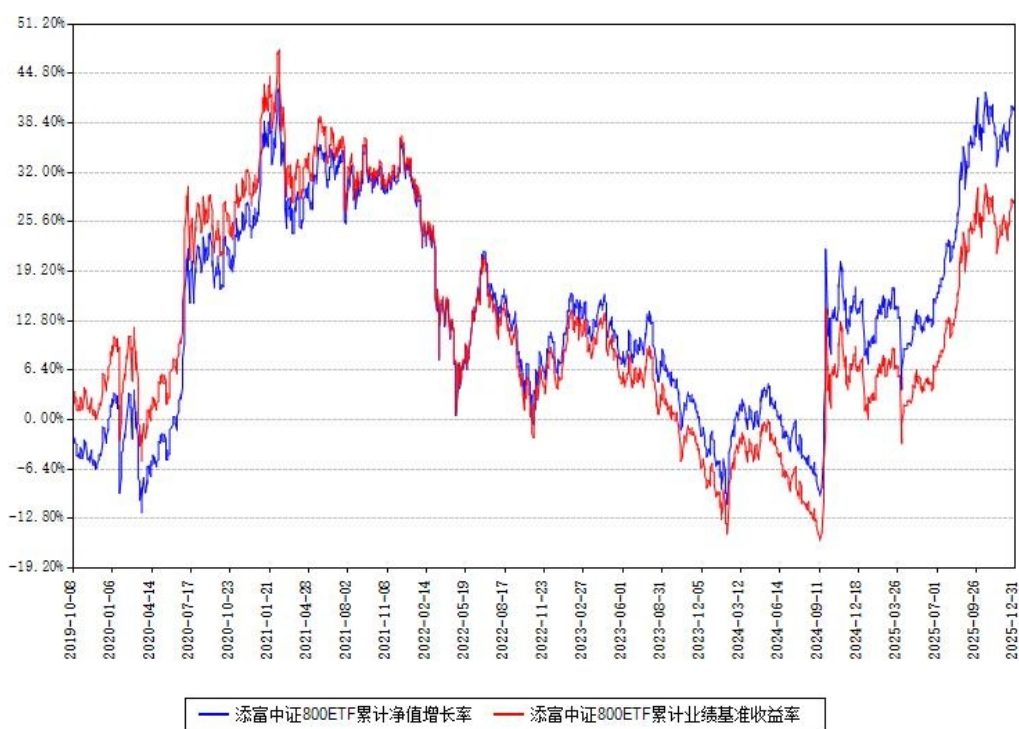
添富中证800ETF累计净值增长率与同期业绩基准收益率对比图

注：本基金建仓期为本《基金合同》生效之日（2019年10月08日）起6个月，建仓期结束时各项资产配置比例符合合同约定。