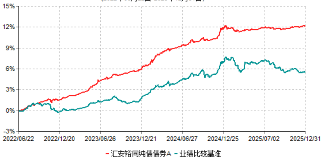
汇安裕同纯债债券A累计净值增长率与业绩比较基准收益率历史走势对比图 (2022年06月22日-2025年12月31日)