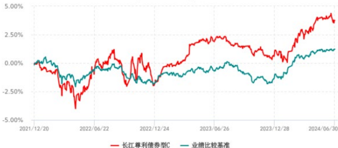
长江尊利债券型C累计净值增长率与业绩比较基准收益率历史走势对比图 (2021年12月20日-2024年06月30日)

注：本基金 C 类份额“自基金合同生效以来”的报告期为 2021 年 12 月 20 日至 2024 年 06 月 30 日。