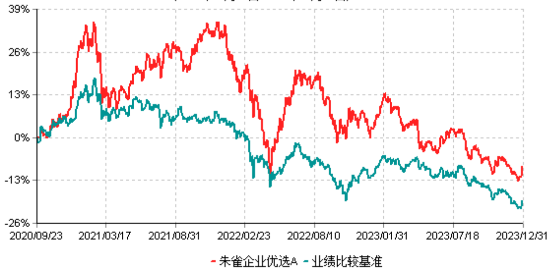
朱雀企业优选A累计净值增长率与业绩比较基准收益率历史走势对比图 (2020年09月23日-2023年12月31日)