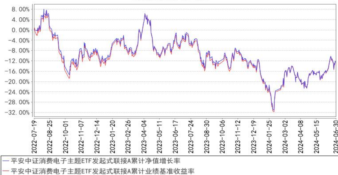
平安中证消费电子主题ETF发起式联接A累计净值增长率与同期业绩比较基准收益率的历史走势对比图