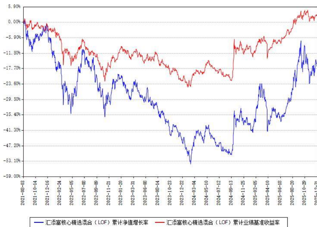
汇添富核心精选混合（LOF）累计净值增长率与同期业绩基准收益率对比图

注：本基金建仓期为本《基金合同》生效之日（2021年08月03日）起6个月，建仓期结