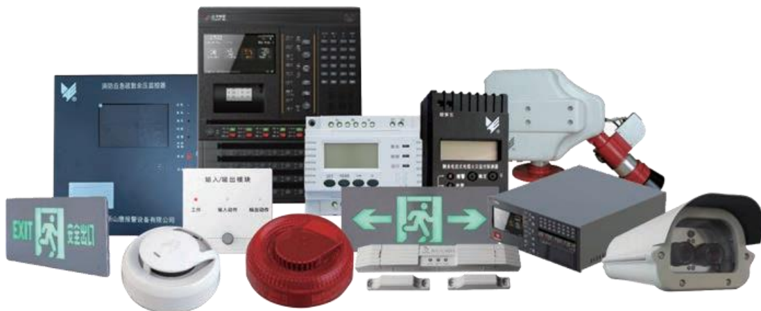
消防报警装备示意图

消防报警装备依托于全资子公司山鹰报警，主要产品有火灾自动报警系统、智能应急照明和疏散指示系统、防火门监控系统、电气火灾监控系统、消防电源监控系统、图像型火灾探测系统、自动跟踪定位射流灭火系统、家用火灾报警系统、余压监控系统、智能防排烟系统、智能消防巡检机器人、集成电池箱火灾防控系统、储能电站、智慧消防物联网平台等 14 个系列 511 种型号，并提供典型行业应用解决方案。