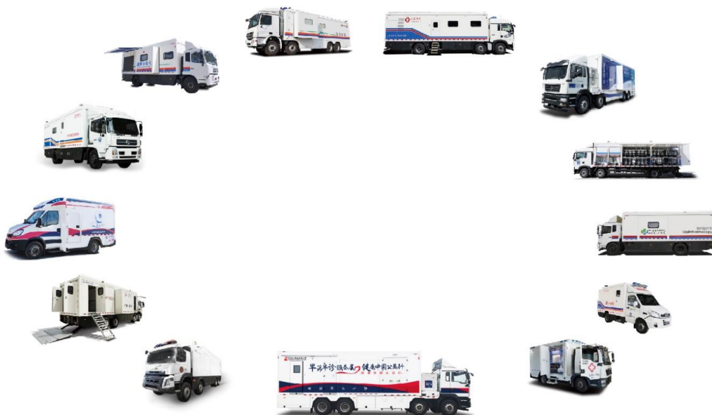
移动医疗保障装备示意图

公司现已具有配置全科甲级移动医疗和医疗应急处置能力，产品也正在向高端智能方向发展，能够提供整套移动医疗应急救援保障方案，目前也是全国移动医疗保障装备最齐全的制造商。