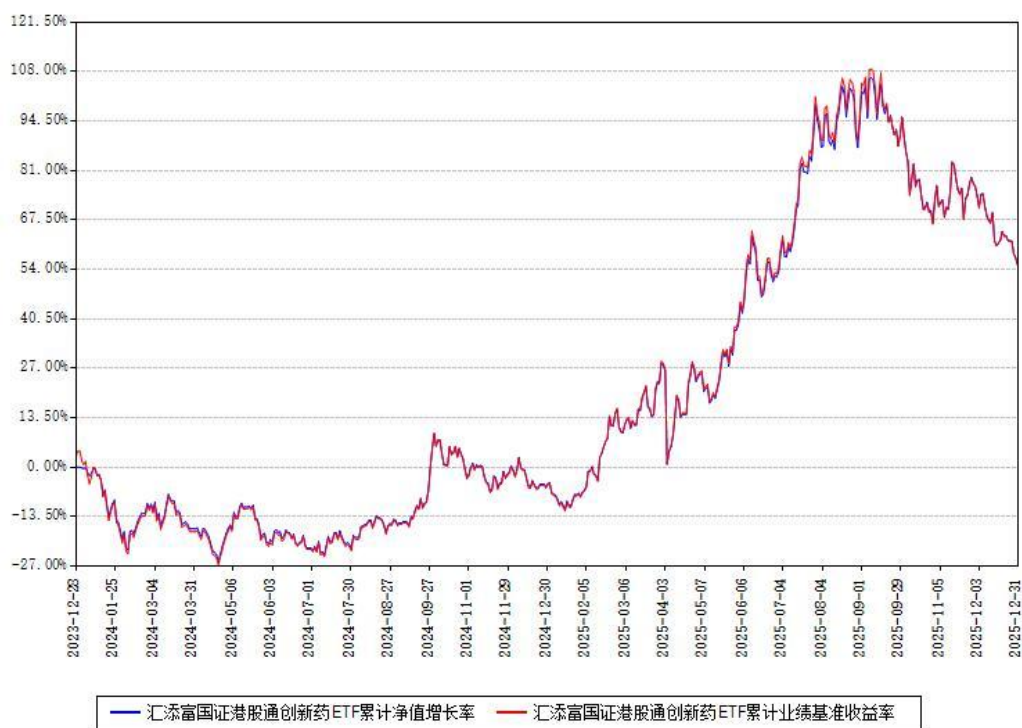
汇添富国证港股通创新药ETF累计净值增长率与同期业绩比较基准收益率对比图

注：本基金建仓期为本《基金合同》生效之日（2023年12月28日）起6个月，建仓期结束时各项资产配置比例符合合同约定。