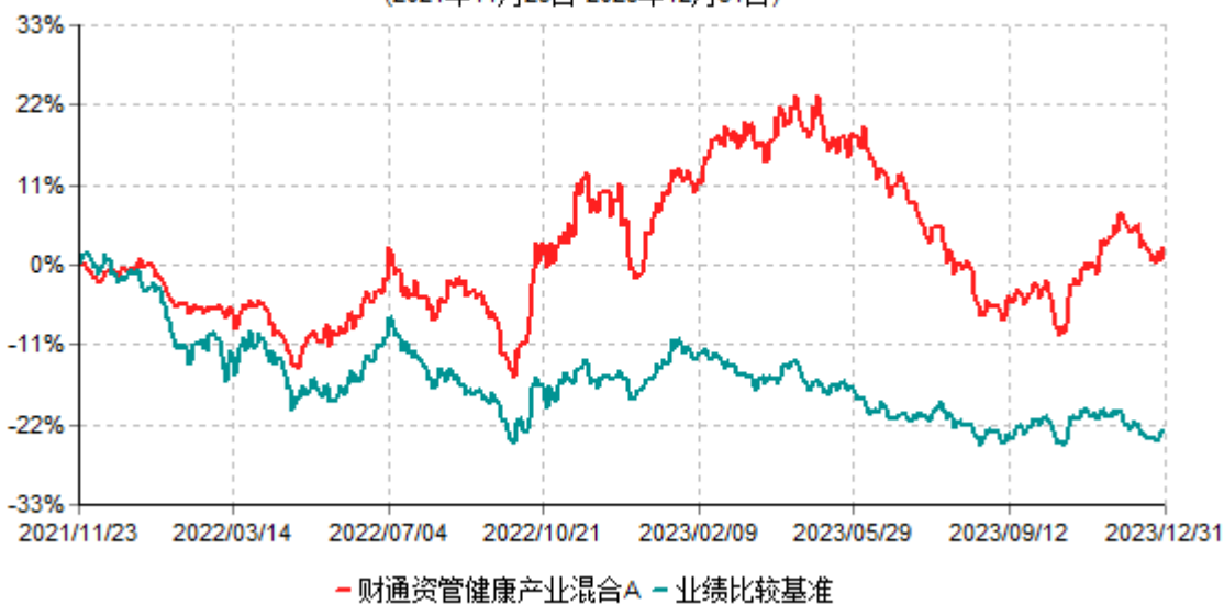
财通资管健康产业混合A累计净值增长率与业绩比较基准收益率历史走势对比图 (2021年11月23日-2023年12月31日)