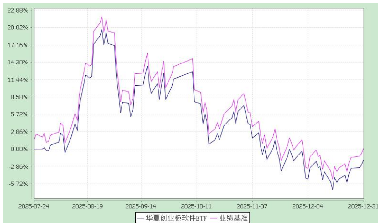
华夏创业板软件交易型开放式指数证券投资基金 份额累计净值增长率与业绩比较基准收益率历史走势对比图 (2025 年 7 月 24 日至 2025 年 12 月 31 日)