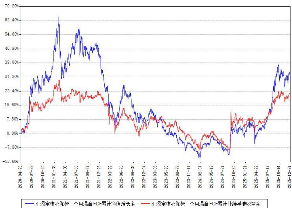
汇添富核心优势三个月混合FOF累计净值增长率与同期业绩基准收益率对比图