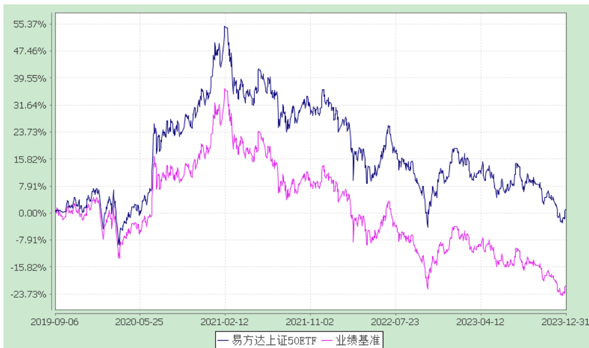
易方达上证 50 交易型开放式指数证券投资基金 份额累计净值增长率与业绩比较基准收益率历史走势对比图 (2019 年 9 月 6 日至 2023 年 12 月 31 日)

注：自基金合同生效至报告期末，基金份额净值增长率为 1.04%，同期业绩比较基准收益率为 -21.30%。