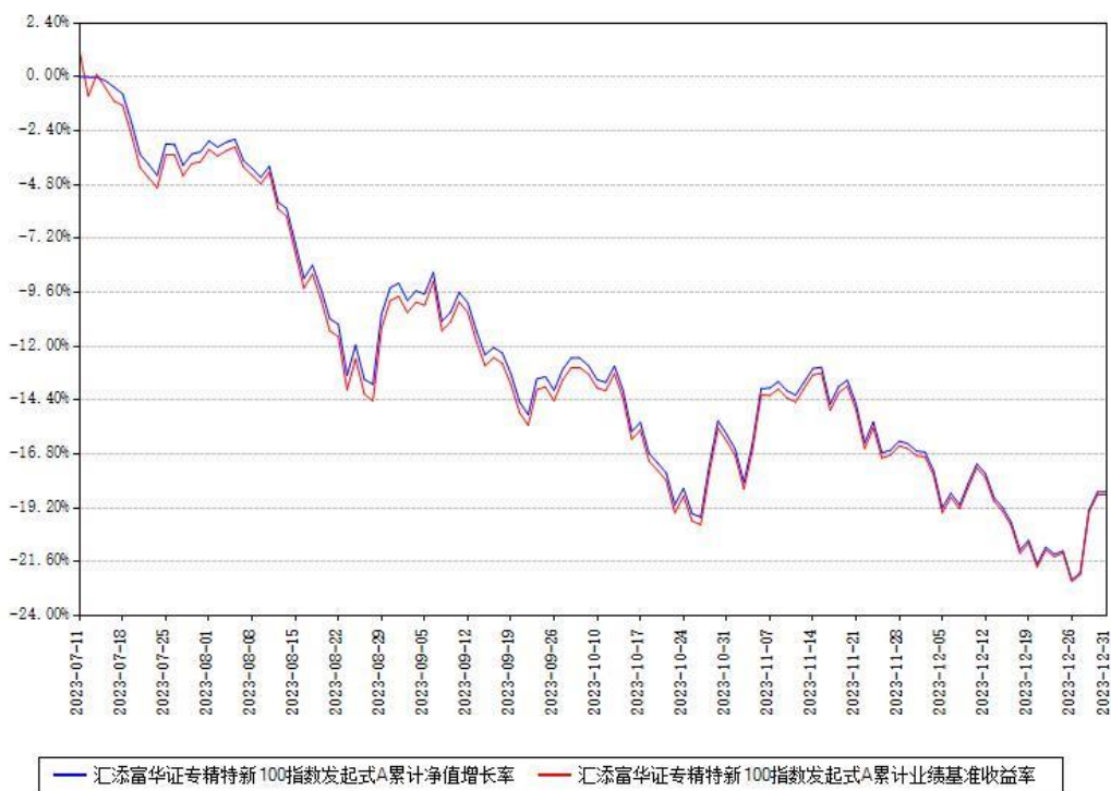
汇添富华证专精特新100指数发起式A累计净值增长率与同期业绩比较基准收益率对比图